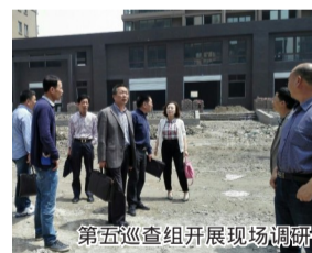
第五巡查组开展现场调研

对当前机关部门和基层站所、办事窗口存在的“庸懒散拖贪”和“只微笑不服务”问题,我市以“ISO9000优化发展环境满意度测评”为抓手,把机关作风效能的评判权、监督权交给办事群众、企业等服务对象。