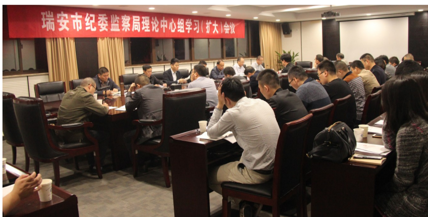
自2015年10月18日中共中央印发《中国共产党廉洁自律准则》和《中国共产党纪律处分条例》以来,我市及时开展学习贯彻活动。目前,全市114个单位相继开展党委(党组)会议学习833人次,理论中心组学习1520人次,专题党课学习2731人次,讲座学习1361人次,集中学习讨论9046人次,通过廉政知识测试、微信群等其他形式学习9083人次。(记者 孙文静)